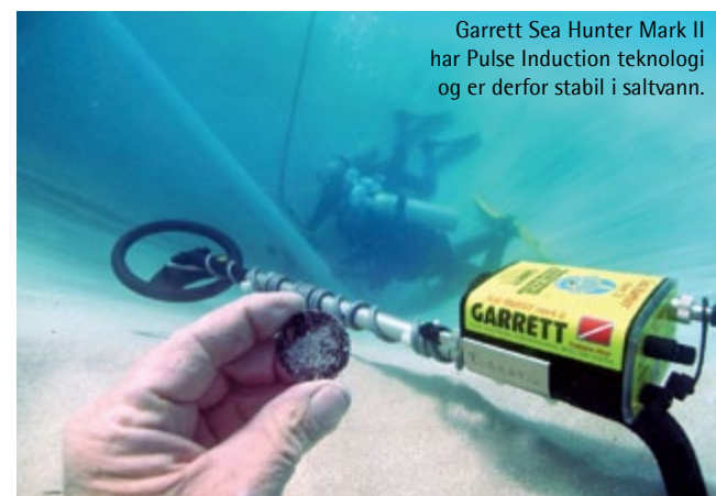
Garrett Sea Hunter Mark II har Pulse Induction teknologi og er derfor stabil i saltvann.

Vi lagerfører flere forskjellige vanntette metalledetektorer som takler det vanskelige salte miljøet på saltvannsstrender, hvor de fleste landdetektorer kommer til kort. Vi har gode kombi-modeller for søking på land og til vanns (vading i saltvann og ferskvann), mens andre er spesielt egnet for undervannsbruk (snorkling og dykking). Vi har de markedsledende modellene! Vi nevner Minelab Excalibur II, Minelab CTX 3030, Minelab SDC 2300, Garrett AT Pro/Gold, Garrett Infinium Land & Sea, Garrett Sea Hunter, Garrett ATX, Tesoro Sand Shark og DetectorPro Headhunter Wader. Vi har også hodetelefoner og pinpoint prober for bruk i vann. Sjekk produktinfo, spesifikasjoner, videoer, priser og lagerstatus på metallsoker.no