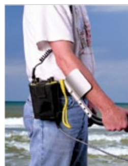
Garrett Sea Hunter Mark II, hofte monteret kontrollboks for vading eller landsøk.

Garrett Sea Hunter Mark II Garrett Sea Hunter Mark II er en pulse induction detektor beregnet for bruk i vann, for dykking og vading, eller på land. Sea Hunter er vanntett til 60 meters dyp. Den egner seg meget godt for dykke- og vadesøk i saltvann og ferskvann, på leting etter smykker, mynter osv. Pris Kr 6990,-