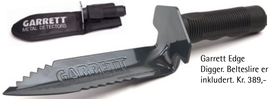
Garrett Edge Digger. Belteslire er inkludert. Kr. 389,-