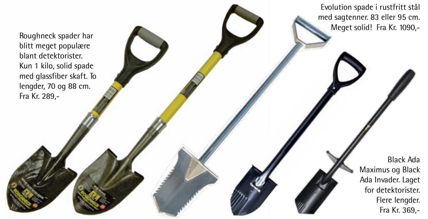
Roughneck spader har blitt meget populære blant detektorister. Kun 1 kilo, solid spade med glassfiber skaft. To lengder, 70 og 88 cm. Fra Kr. 289,-