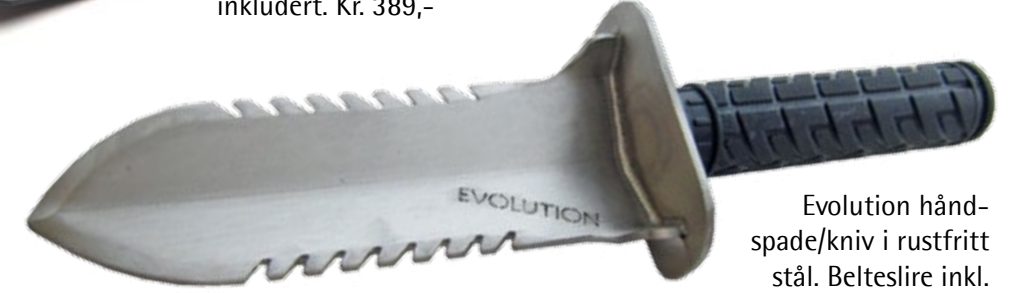
Evolution håndspade/kniv i rustfritt stål. Belteslire inkl. Kr. 469,-

Se hele vårt utvalg på metallsoker.no Vi har også meget solide Evolution sandscoop i rustfritt stål, for montering på skaft, for vading. Vi har også Garrett og Roughneck hakker.